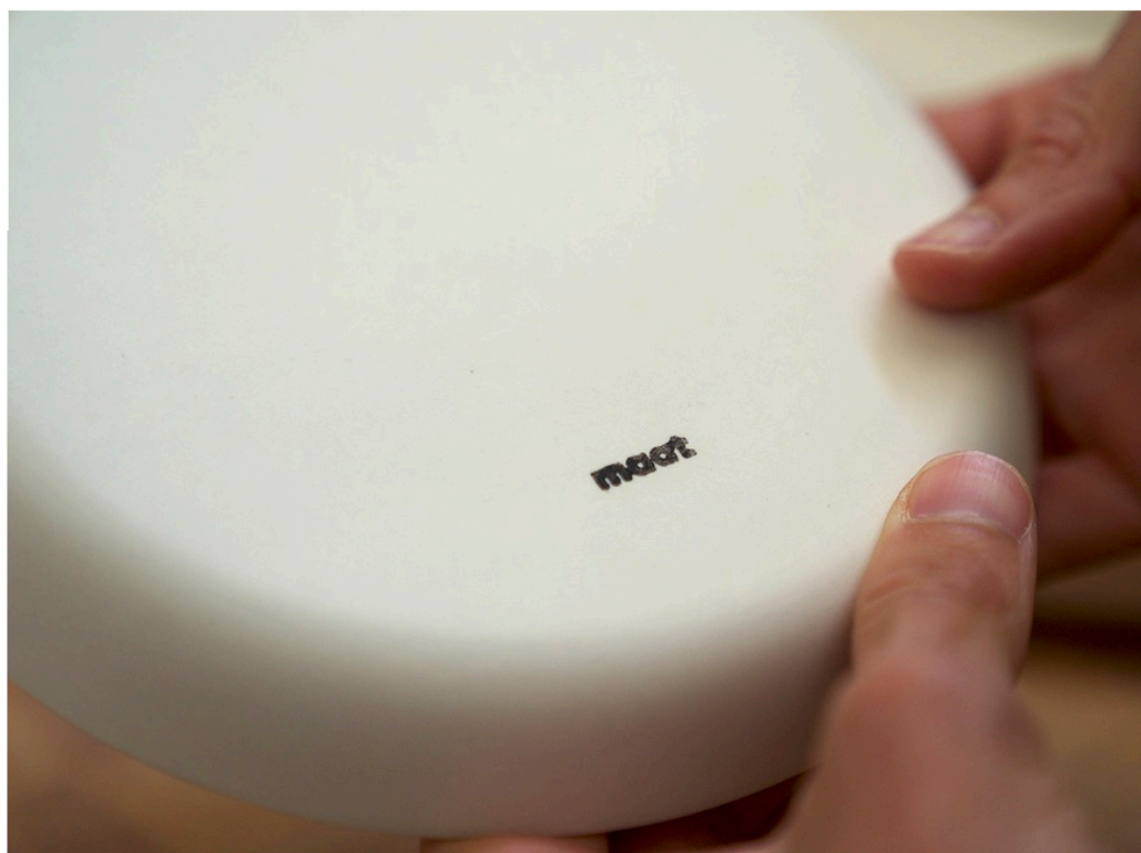
MAAT x Margarida Fabrica